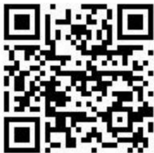
回乡返沅毕业生登记二维码